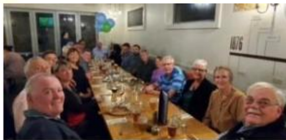
Radość ze strony towarzyskiej; Kolacja po posiedzeniu Rady Krajowej; Lunch podczas programu dla partnerów