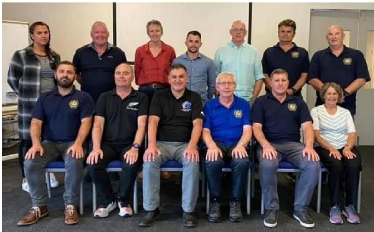
Zarząd IPA Nowa Zelandia wraz z delegatami

Zarząd Krajowy Sekcji IPA Nowa Zelandia, delegaci i partnerzy odbyli Walne Zgromadzenie w dniach 9-10 kwietnia 2021 roku w pięknym dystrykcie Tasman w Nowej Zelandii. Było to pierwsze osobiste spotkanie dla nowego Zarządu, wybranego w kwietniu 2020 roku.